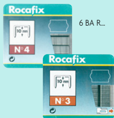
6 BA R...