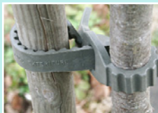
5 CS03/04 - 5 CEL 4/5